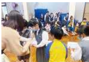
大家各出其謀，務求最快完成。

同學須以紙張想出不同的連接器，然後把球運送到目的地，過程緊張刺激，既學會動腦筋、多思考，也學會與同學之間通力合作。