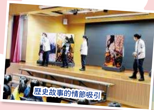
歷史故事的情節吸引