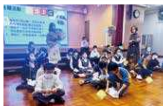
我們都在聽指令，想辦法製作運送器。