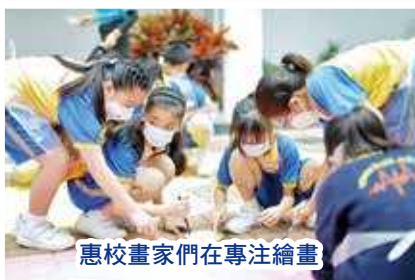
惠校畫家們在專注繪畫