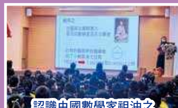
認識中國數學家祖沖之