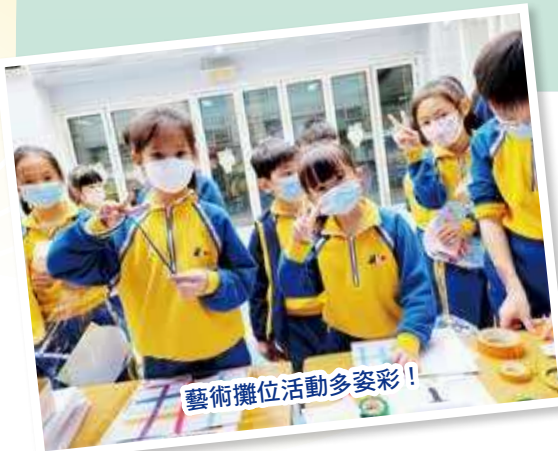
藝術攤位活動多采！