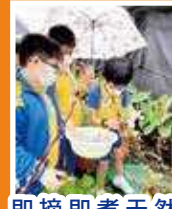
即摘即煮天然洛神花果醬