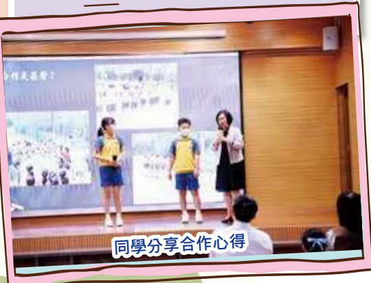
同學分享合作心得