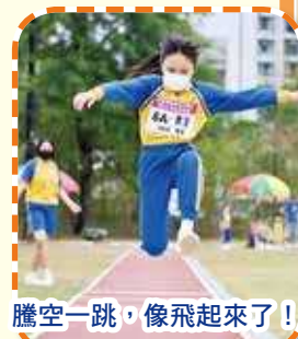
騰空一跳，像飛起來了！