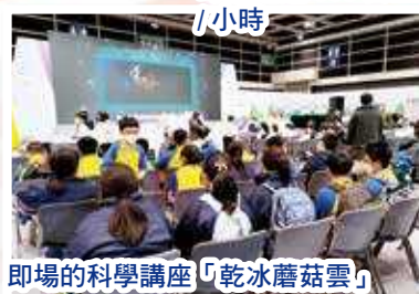
即場的科學講座「乾冰蘑菇雲」