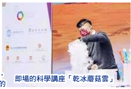
即場的科學講座「乾冰蘑菇雲」