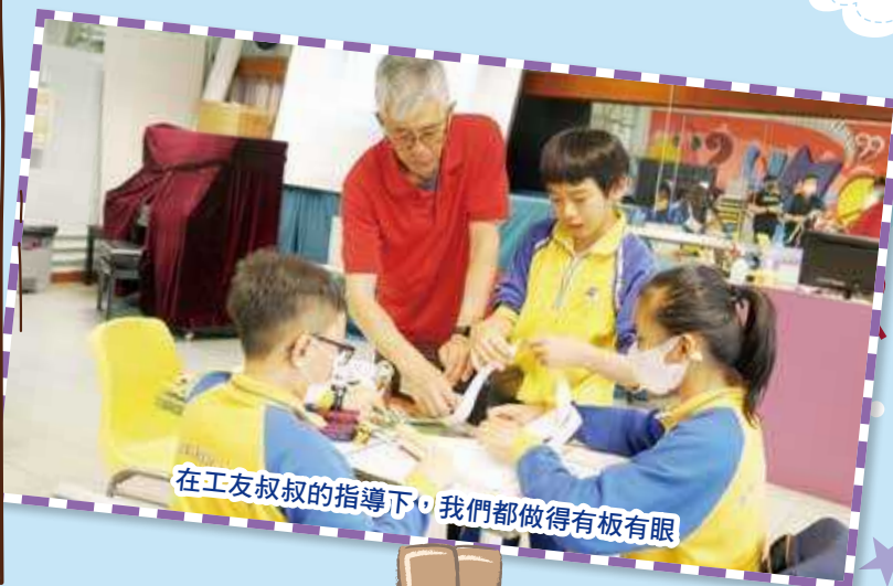
在工友叔叔的指導下，我們都做得有板有眼