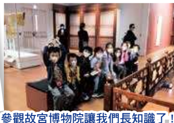
參觀故宮博物院讓我們長知識了！