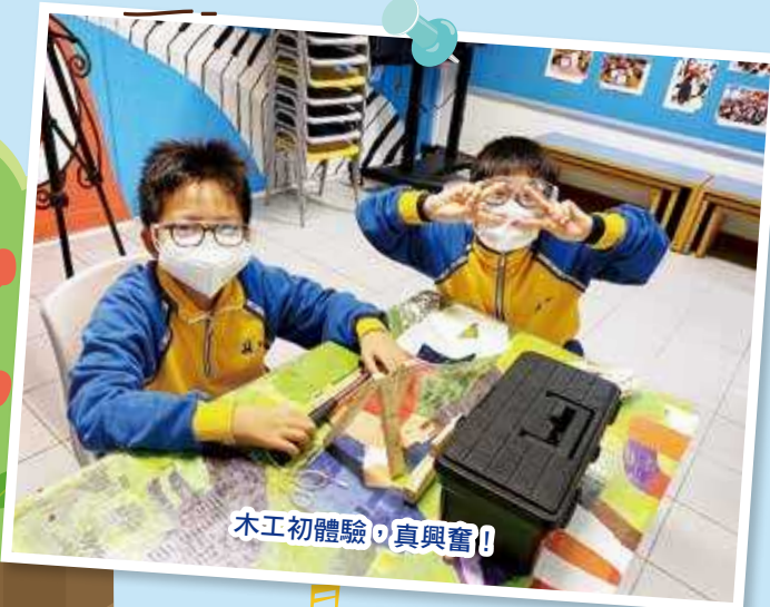
木工初體驗，真興奮！