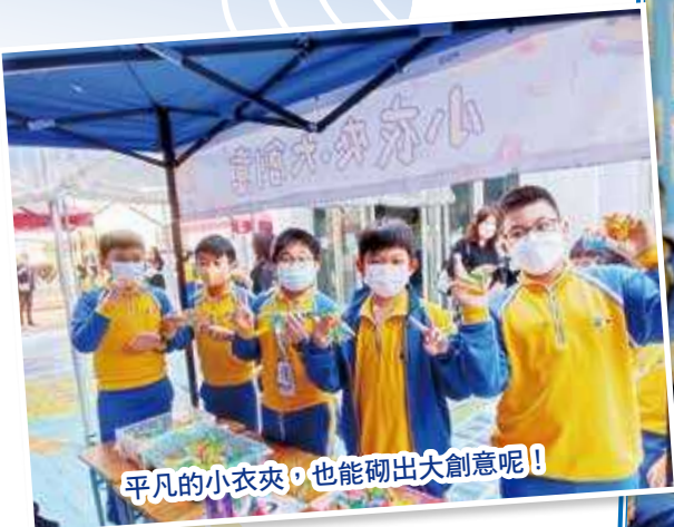
平凡的小衣夾，也能砌出大創意呢！