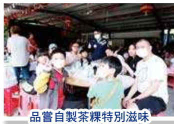
品嚐自製茶糰特別滋味