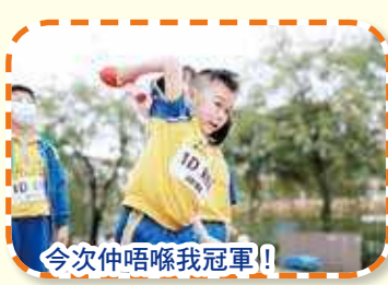
今次仲唔喺我冠軍！