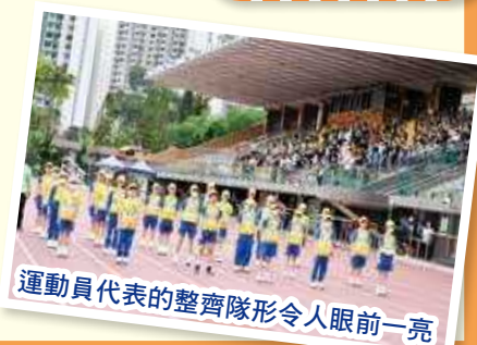
運動員代表的整齊隊形令人眼前一亮