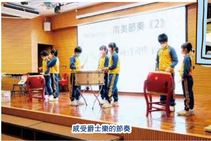
感受爵士樂的節奏