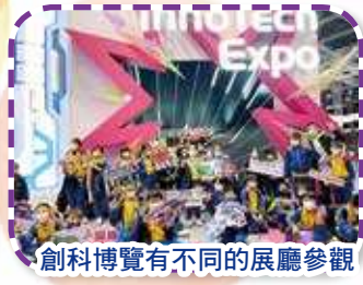
創科博覽有不同的展廳參觀