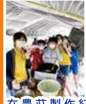
在農莊製作紅豆餅，學習欣賞大自然