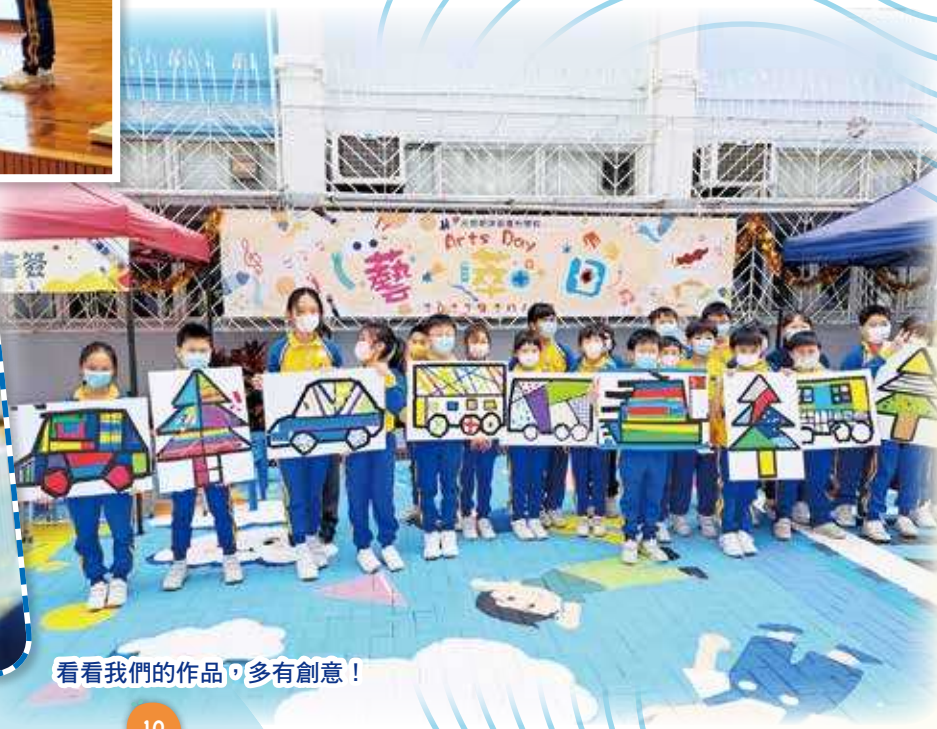
看看我們的作品，多有創意！