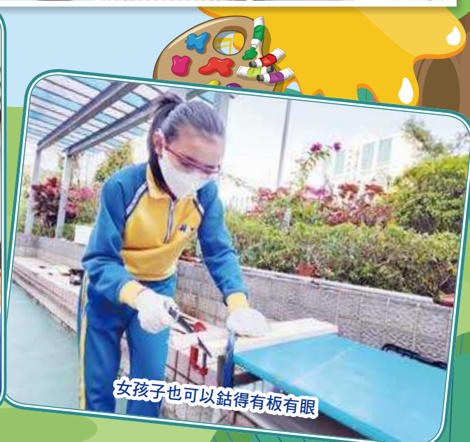
女孩子也可以鋸得有板有眼