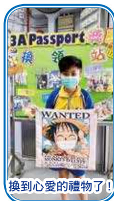
換到心愛的禮物了！