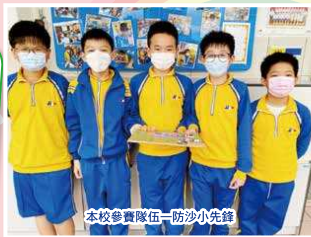
本校參賽隊伍—防沙小先鋒