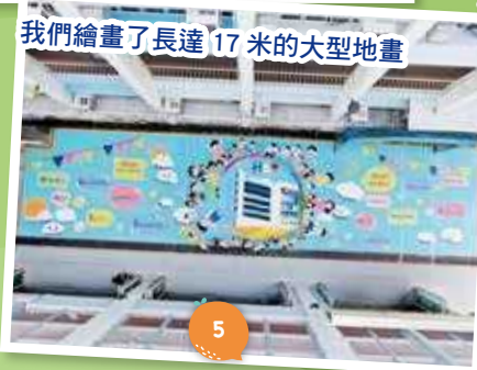
我們繪畫了長達17米的大型地畫