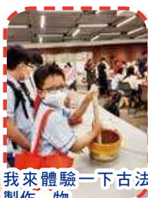
我來體驗一下古法製作物