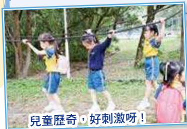
兒童歷奇，好刺激呀！