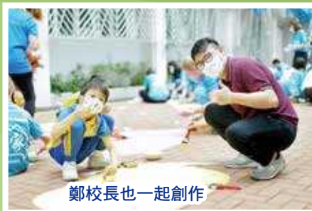
鄭校長也一起創作