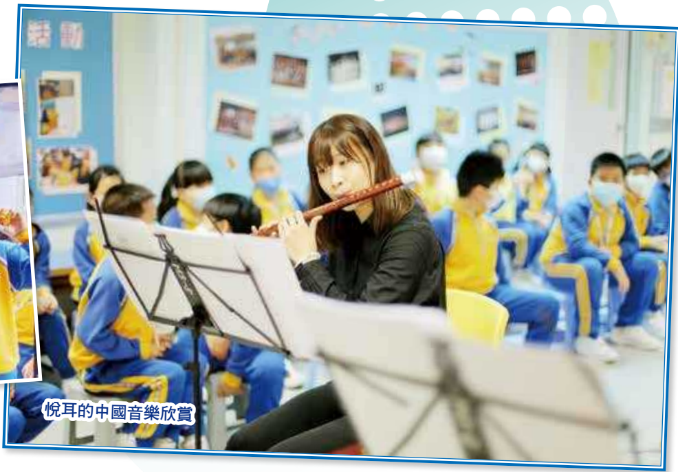
悅耳的中國音樂欣賞