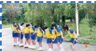
手挽手，遇到困難一起走