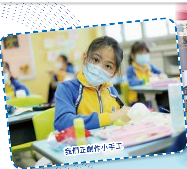
我們正創作小手工