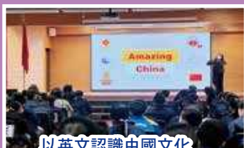
以英文認識中國文化