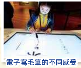
電子寫毛筆的不同感受