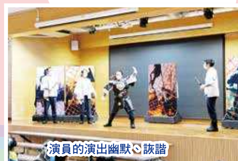
演員的演出幽默、詼諧