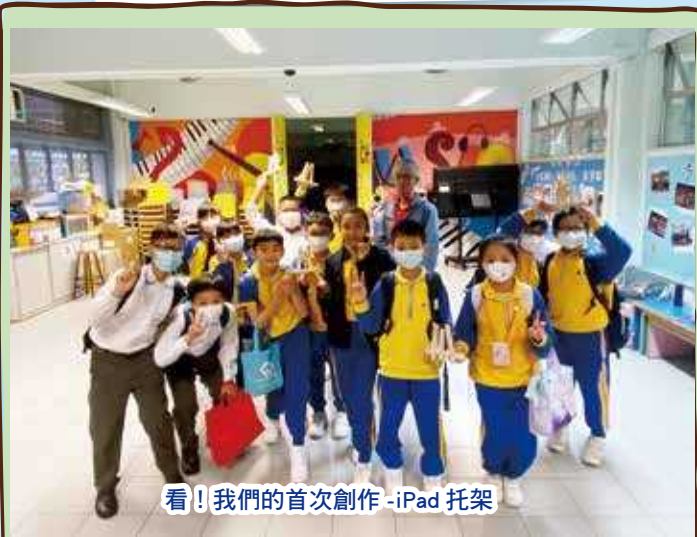
看！我們的首次創作 - iPad 托架

除了老師之外，課堂也邀請了惠校的工友一布先生介紹木工工具和示範製作技巧。學生體驗運用批士、尖鋸、手鋸、木材及釘進行鋸木及上釘，學習運用磨砂紙進行木材打磨。