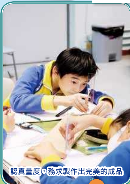
認真量度，務求製作出完美的成品