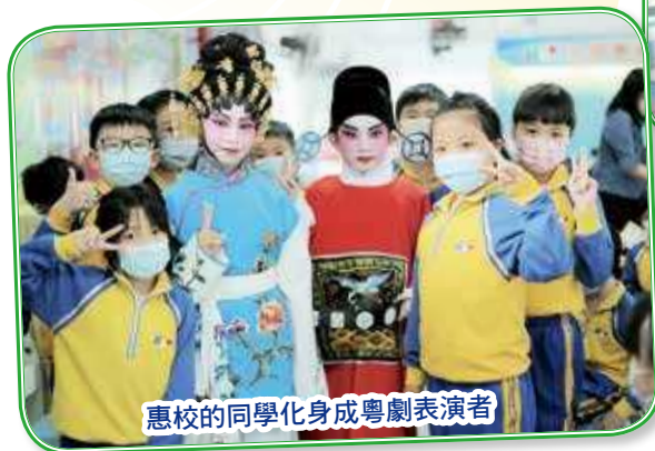
惠校同學化身成粵劇表演者