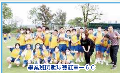
畢業班閃避球賽冠軍—6C