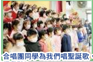
合唱團同學為我們唱聖誕歌，很動聽！