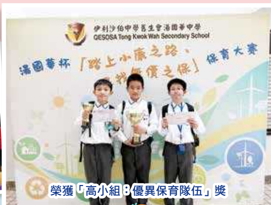
榮獲「高小組：優異保育隊伍」獎