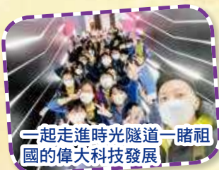
一起走進時光隧道一睹祖國的偉大科技發展