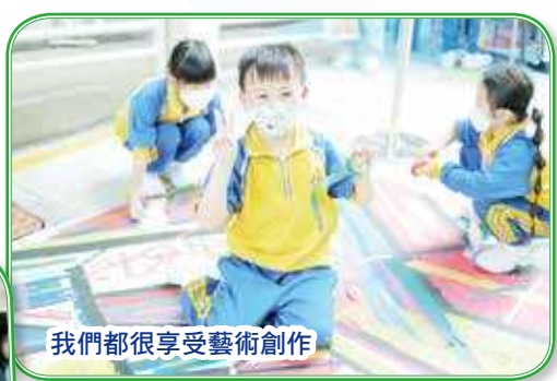
我們都很享受藝術創作