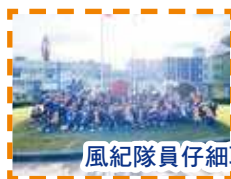
風紀隊員仔細聆聽當天的活動介紹

本校風紀隊於十二月到達八鄉少年警訊中心進行風紀領袖訓練營。風紀訓練營的目的是培養學生與人合作、服務他人的精神，成為一個具備領導才能的風紀。