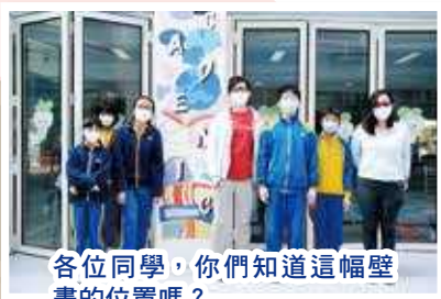
各位同學，你們知道這幅壁畫的位置嗎？