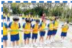
哪一隊能最快把球傳過去？