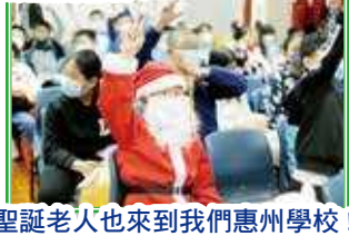
聖誕老人也來到我們惠州學校！