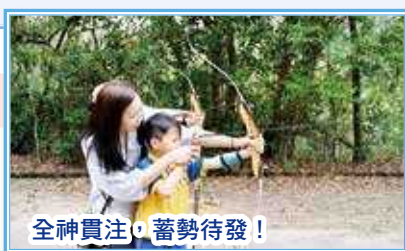
全神貫注，蓄勢待發！