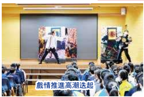
戲情推進高潮迭起

本校邀請了本地劇團 7A 班戲劇組到校演出中國傳統的經典故事「三十六計」。學生觀賞期間非常投入，反應熱烈、正面，充分理解劇中「三十六計」的故事內容，並且學習到當中蘊藏的「大智慧」。