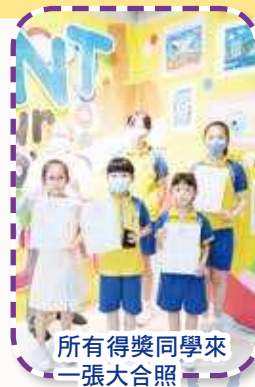
所有得獎同學來一張大合照