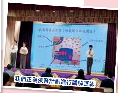
我們正為保育計劃進行講解匯報