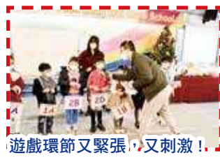
遊戲環節又緊張，又刺激！

舉行聯歡會時，鄭校長、陳副校長更到各班探望大家，同學們爭相拍照留念，大家的臉上都露出了幸福的笑容。