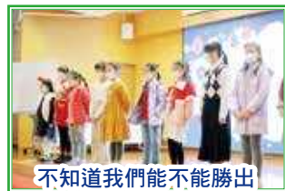
不知道我們能不能勝出

同學們參與了小遊戲及大合唱的環節，共同感受歡樂的聖誕氣氛。最後更有聖誕大抽獎，得獎的幸運兒欣喜若狂，事後更與嘉賓合照，為這個聖誕節留下歡樂的倩影。