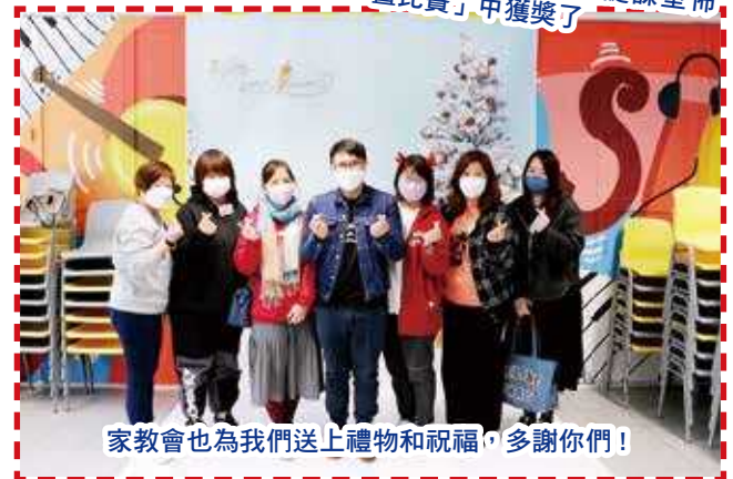
家教會也為我們送上禮物和祝福，多謝你們！