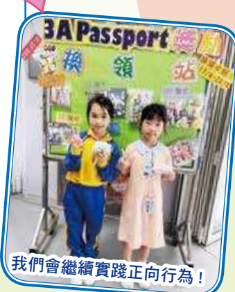
我們會繼續實踐正向行為！