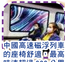
中國高速磁浮列車的座椅舒適，最高時速超過 600 公里/小時