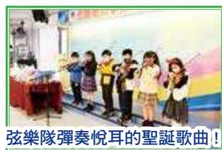
弦樂隊彈奏悅耳的聖誕歌曲！