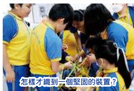
怎樣才織到一個堅固的裝置？