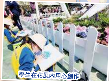
學生在花展內用心創作