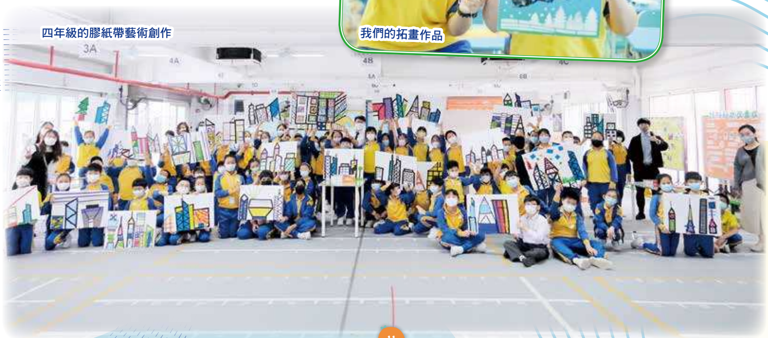
四年級的膠紙帶藝術創作