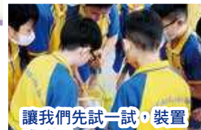
讓我們先試一試，裝置成功嗎