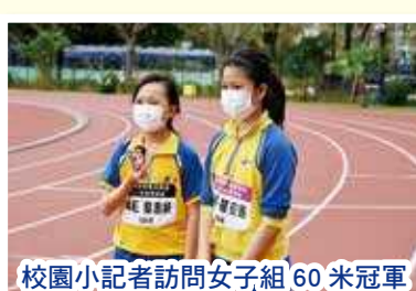
校園小记者訪問女子組60米冠軍