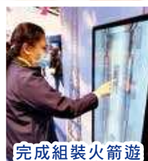
完成組裝火箭遊戲後，可獲得自己做太空人的照片，真帥！