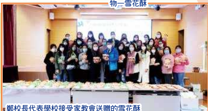
鄭校長代表學校接受家教會送贈的雪花酥