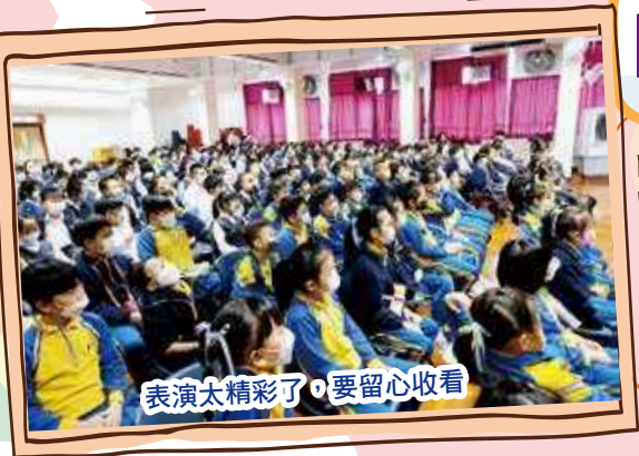
表演太精彩了，要留心收看

本校邀請了本地劇團 7A 班戲劇組到校演出中國傳統的經典故事「三十六計」。學生觀賞期間非常投入，反應熱烈、正面，充分理解劇中「三十六計」的故事內容，並且學習到當中蘊藏的「大智慧」。