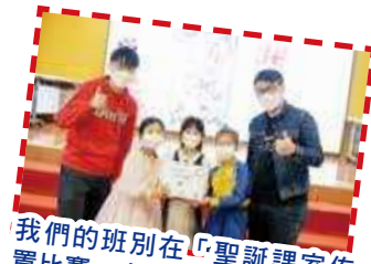
我們的班別在「聖誕課室佈置比賽」中獲獎了