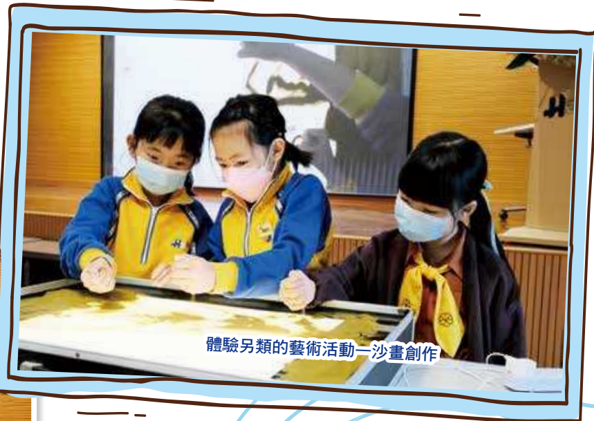
體驗另類的藝術活動—沙畫創作