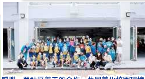
感謝一眾社區義工的合作，共同美化校園環境