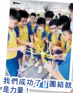
我們成功了！團結就是力量！