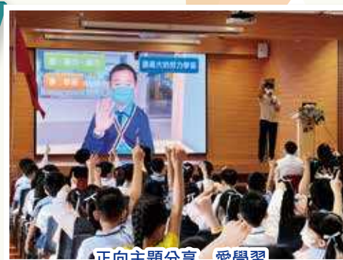
正向主題分享 愛學習