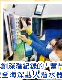
再創深潛紀錄的「奮鬥者」號全海深載人潛水器的模擬駕駛艙